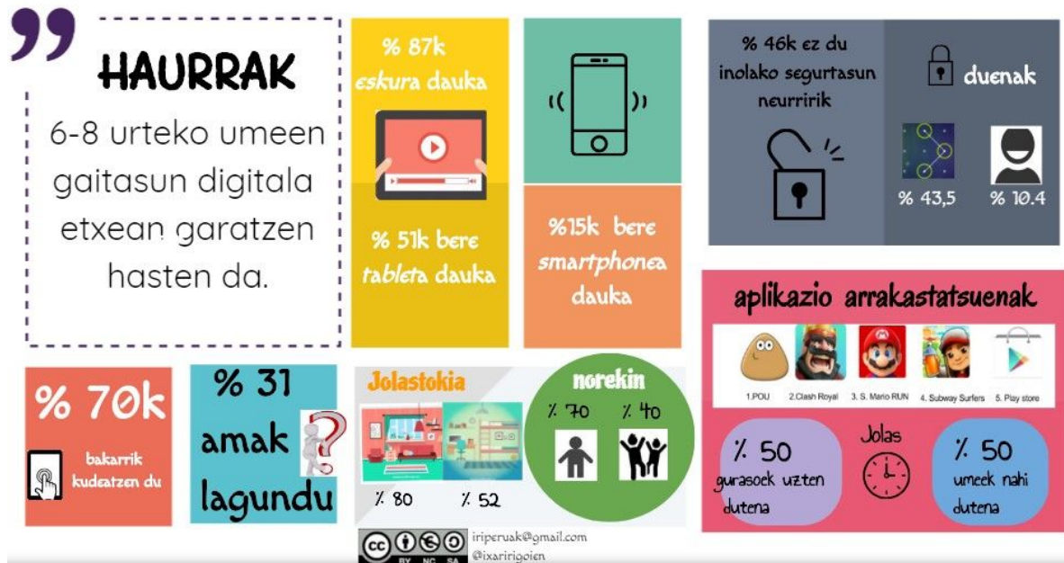
4. irudia: 6-8 urteko umeen gaitasun digitala, ondorio nagusiak

segurtasun neurririk jarri gabe. %70k bakarrik kudeatzen du eta ez dago euskal aplikaziorik arrakastatsuenen artean.” Ikus 4. irudia.